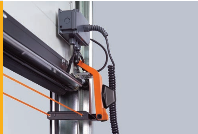
Voreilende Lichtschanken bei Industrie-Sectionaltoren sichern berührungslos. Eine zusätzliche Prüfung der Schließkräfte kann dadurch entfallen.

Ein weiterer Vorteil: Bei Toren mit berührungsloser, für den Personenschutz zugelassener Technik entfällt die Prüfung der Schließkräfte. So sparen Sie sich die Mehrkosten für diese Prüfung.